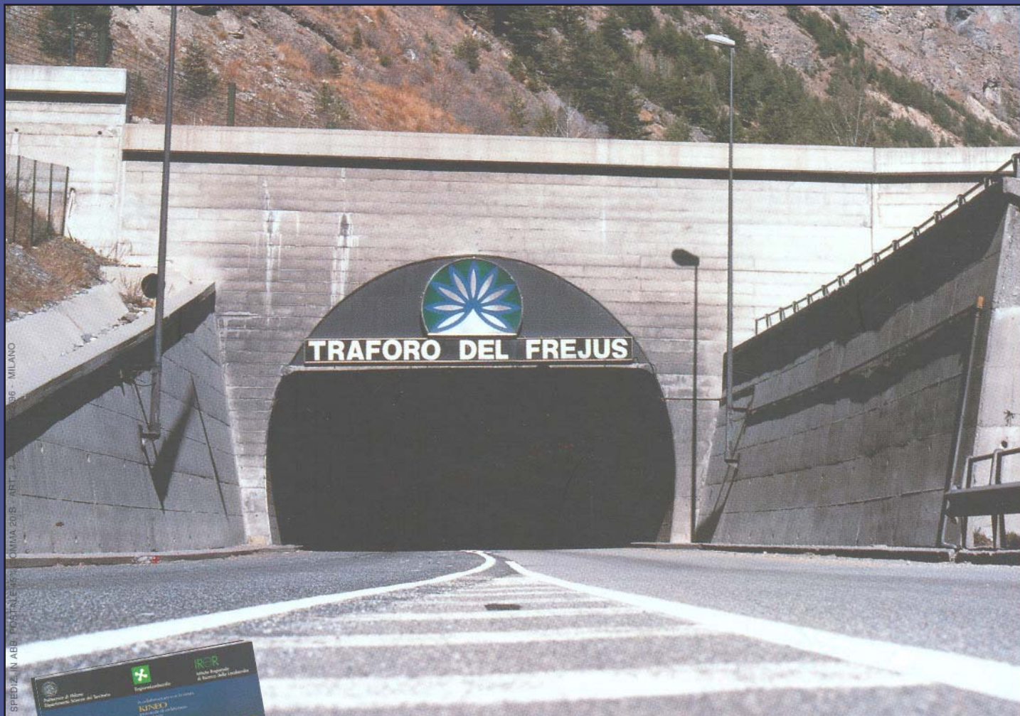
SPEDIZIONE IN ABB. POSTALE 45 - C.M.A. 2018 - ART. 2 - 996 - MILANO