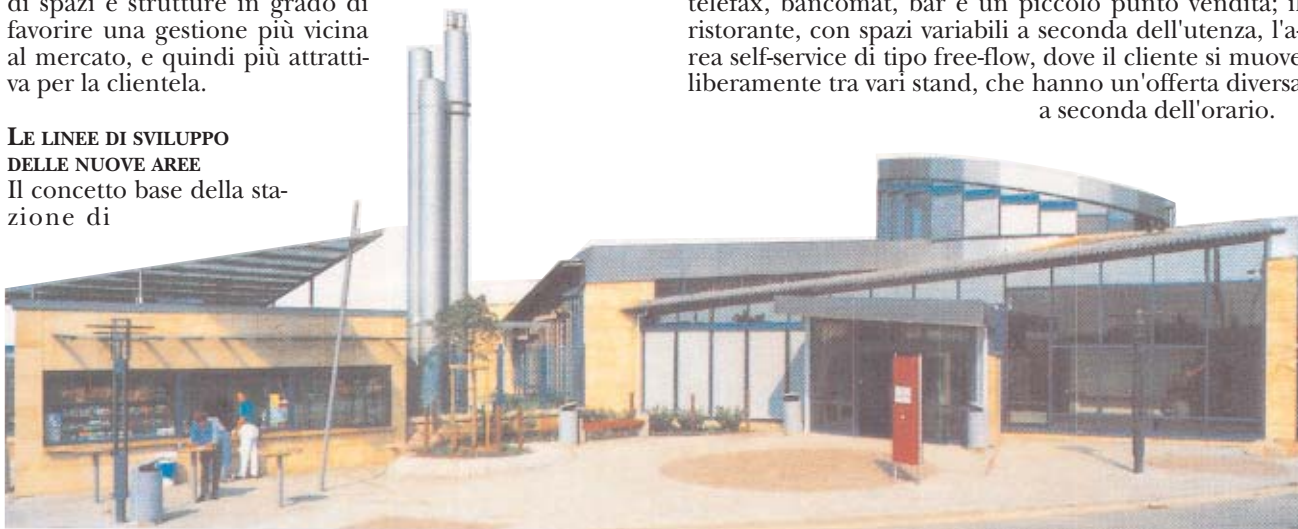
▲ Veduta dell'edificio di ristoro e, sopra, della stazione di servizio dell'area di Helmstedt-Süd, presso Hannover.

Nell'edificio della stazione, poi, si individuano due aree principali: la lounge, area di accoglienza con telefono, telefax, bancomat, bar e un piccolo punto vendita; il ristorante, con spazi variabili a seconda dell'utenza, l'area self-service di tipo free-flow, dove il cliente si muove liberamente tra vari stand, che hanno un'offerta diversa a seconda dell'orario.