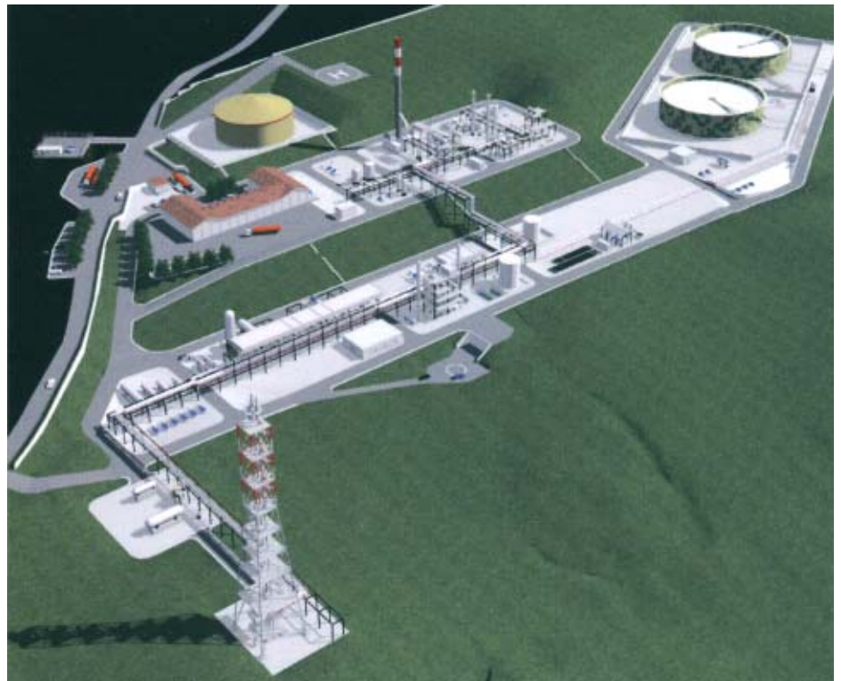
Tempa Rossa - Centro di trattamento

Se tutto va bene Total prevede di sfruttare il giacimento entro il 2009.