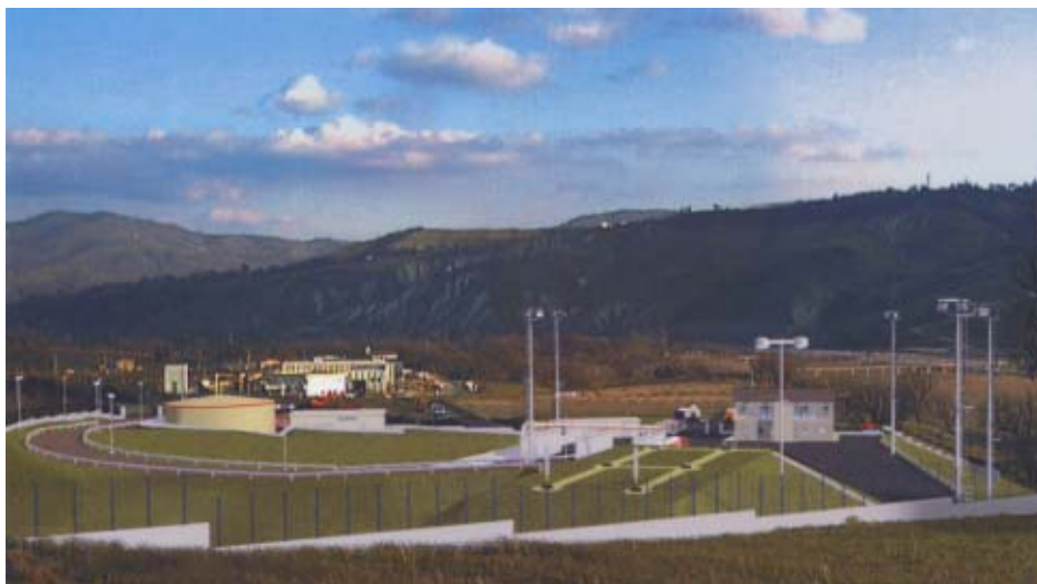
Tempa Rossa - Centro di stoccaggio

per le esigenze dell'ambiente - ribadisce D Filippo - perchè negli accordi con i concessionari è prevista la realizzazione di un sofisticato sistema di monitoraggio dell'ambiente, i cui costi di costruzione e gestione risultano totalmente a carico del concessionario (che è anche vincolato all'uso delle migliori tecnologie disponibili per mitigare al massimo l'impatto ambientale). Gli stessi proventi delle royalties verranno, poi, reimpiegati in attività di sviluppo dei territori interessati dalle estrazioni.