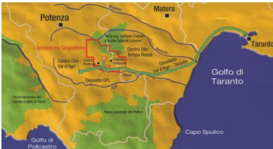
Tempa Rossa - Localizzazione

L'estrazione petrolifera verrà, in ogni caso, condotta con il massimo riguardo