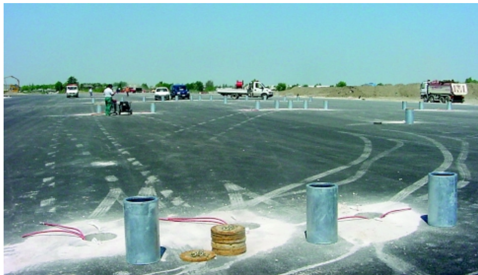
Posa del sistema di luci degli aiuti visivi luminosi

Ulteriori interventi hanno riguardato la minimizzazione dell'impatto acustico sulla città, il potenziamento il sistema delle Taxiways con una bretella ad uscita rapida, per minimizzare i tempi di occupazione della pista di volo da parte degli aerei e aumentare così la sua potenzialità. ■