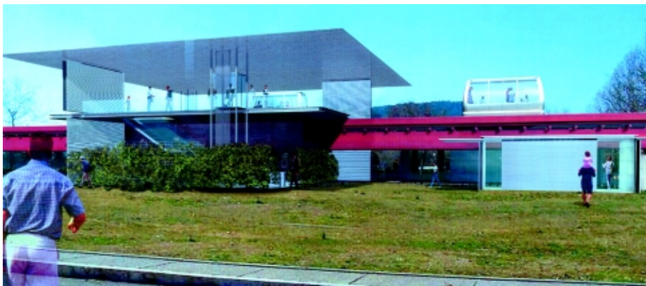
Simulazione di una delle stazioni del minimetrò di Perugia disegnate da Jean Nouvel

del progetto del secondo tratto, verso Montelucente.