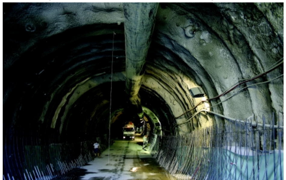
Particolare della galleria del minimetrò scavata sotto il centro storico di Perugia

Quanto alla seconda tratta, la cui progettazione definitiva è terminata, il Comune di Perugia parteciperà al Bando del ministero delle Infrastrutture e dei trasporti per l'accesso ai finanziamenti pubblici.