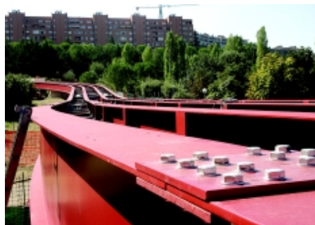
Particolare del viadotto del primo tratto del minimetrò di Perugia

prevede di estendersi per un altro chilometro verso la periferia est, a Monteluce, si articola in sette fermate e tre gallerie, e utilizza un sistema a fune sviluppato dalla Leitner di Vipiteno che rappresenta un elemento di novità nel panorama trasportistico italiano, così come lo è, in parte, il tipo di finanziamento e di gestione del progetto adottato dal Comune di Perugia.