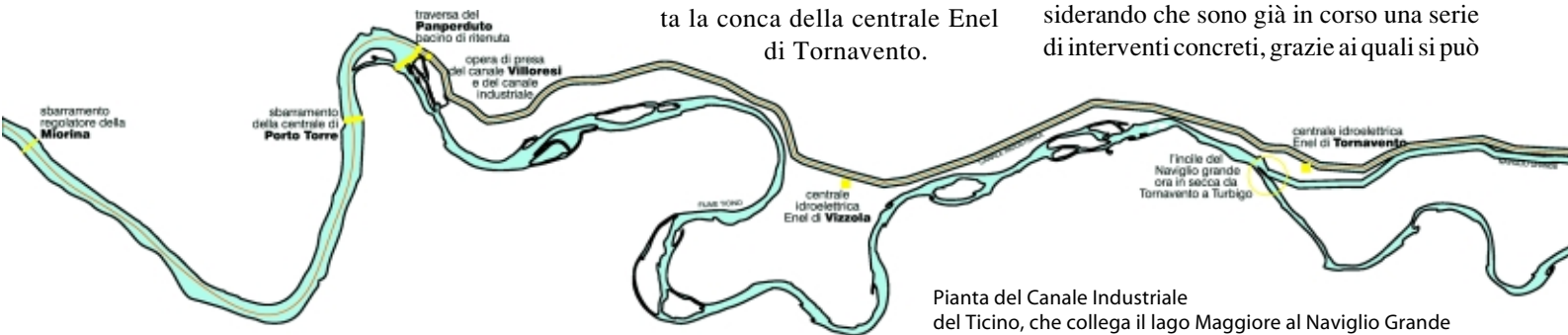
Pianta del Canale Industriale del Ticino, che collega il lago Maggiore al Naviglio Grande