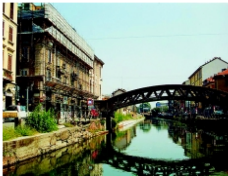
Particolare del Naviglio Grande a Milano

Poi le trasformazioni economiche degli ultimi decenni hanno fatto perdere di competitività al sistema, così da essere progressivamente abbandonato; ma nel momento stesso in cui questo avveniva si sono sviluppati una serie di fattori che hanno riproposto il tema del ripristino della navigabilità, anche se in una prospettiva diversa, alla luce della crescente importanza del tempo libero e delle attività culturali, sportive e ricreative, in grado di valorizzare il pregio ambientale del territorio attraversato e le numerose opere monumentali e artistiche.