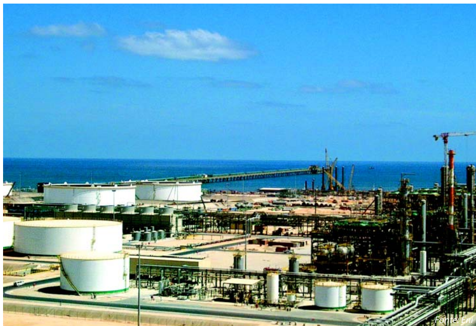
Veduta del centro di trattamento di Mellitah, sulla costa libica

Operare in fondali profondi ha reso necessario eseguire alcune modifiche alla nave e, in particolare, a tutto il sistema di ormeggio.