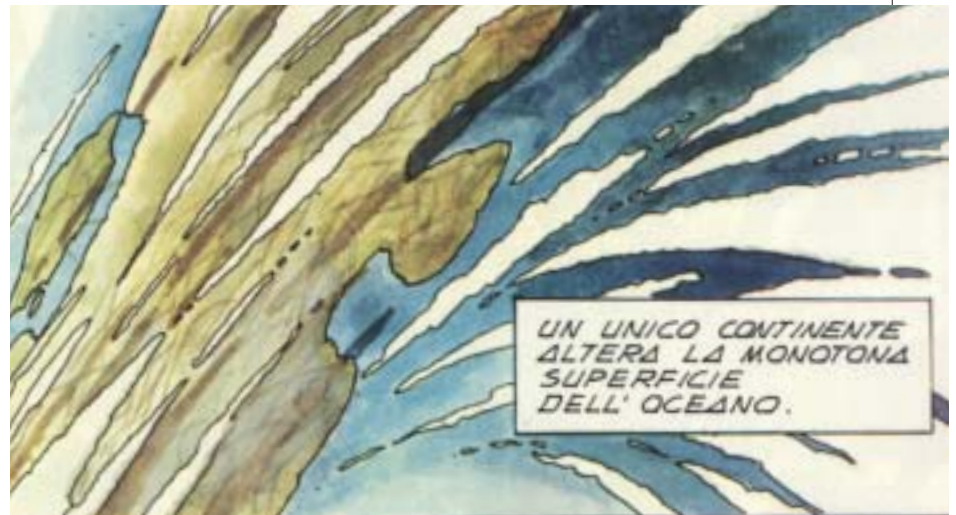
Juan Gimenez, vedute dallo spazio e particolare del pianeta Palidon IV, coperto dalle acque per il 70 per cento e con un unico continente emerso, interamente urbanizzato, 1982, tavola a colori per "La Stella nera", L'Eternauta n. 9, novembre 1982.