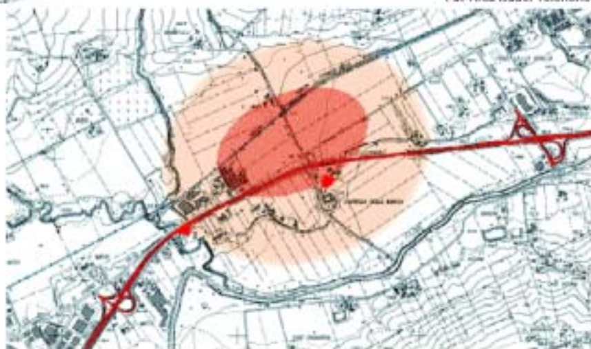
Pav Area leader Tolentino

Alcuni di questi interventi erano già in fase avanzata di progettazione da parte